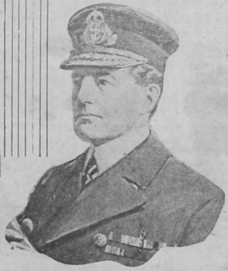
ALMIRANTE BEATTY, heroe de la batalla de Jutlandia, fallecido anoche.

¡Diga el estimable lector si contemplando esos cuadros de nuestra campiña, no siente dulces sensaciones y nostalgias infinitas!